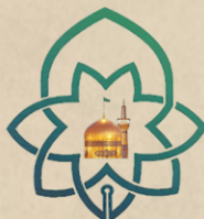
حوزه علمیه خراسان