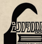
مکتب نوری مشهد