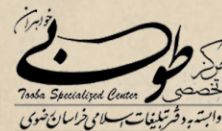
مکتب نوری مشهد