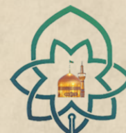
حوزه علمیه خراسان دفتر خراسان