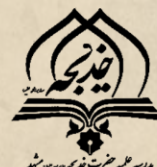
مکتب نوری مشهد