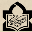
مکتب نوری مشهد