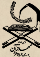
مکتب نوری مشهد